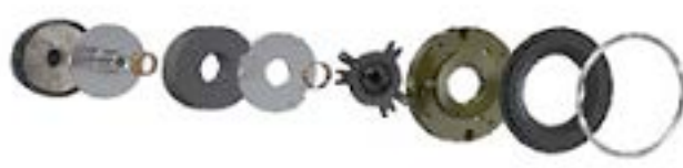
WFR tweeter assembly