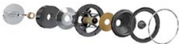
bass/mid driver assembly

ツイーターユニットはDIAMOND 11シリーズ用に開発されたWFR™ (Wide Frequency Response) DIAMOND 300シリーズのために微調整したソフトドームを搭載しています。ツイーターユニットもウーファー/ミッドレンジユニットと同様に特殊形状の銅キャップ付きポールピースを採用したことで共振周波数が低減され明瞭かつ精密な高周波ディテールを達成しています。